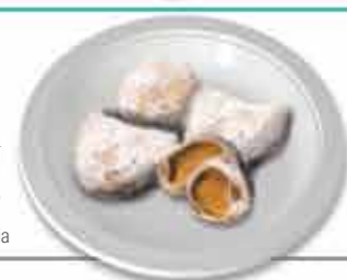
Meias Luas Doce de origem conventual

Para além dos inúmeros pratos de Bacalhau, dos quais se destaca o "Bacalhau à Viana", são dignas de realce as famosas iguarias gastronómicas, que enchem o olho e a barriga, como o arroz de lampreia, o sarrabulho, os diversos peixes e mariscos, entre outros, pratos procurados por excelência