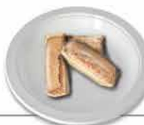
Sidónios Homenagem a Sidónio Pais