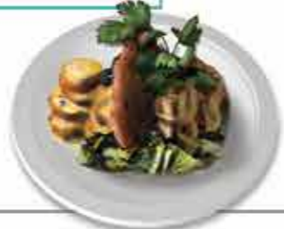
Bacalhau à Viana Aspeto característico, assemelhando-se a um pastel folhado