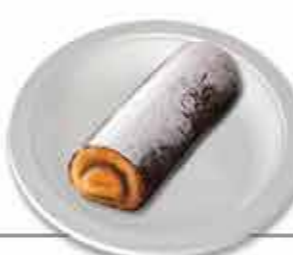
Torta de Viana Um dos mais tradicionais doces do concelho