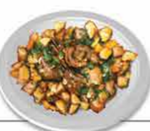
Cabrito à Serra d'Arga Cabrito assado no forno, prato típico da região