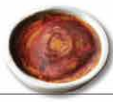
Leite Creme Iguaria tradicional