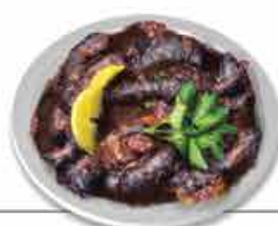
Lampreia Receita tipicamente portuguesa