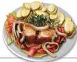
Bacalhau de Cebolada Prato reinante dos cardíacos