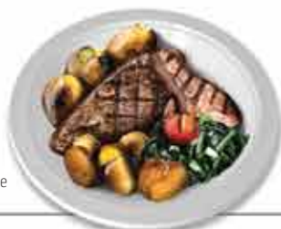
Naco à Minhota Carnes para paladares exigentes