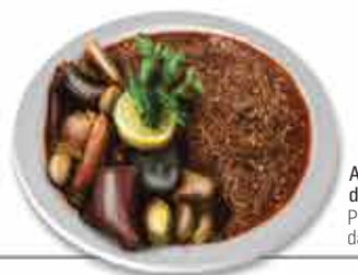
Arroz de Sarrabulho Prato rei da gastronomia

A Gastronomia de Ponte de Lima apresenta iguarias e sabores únicos. O "Arroz de Sarrabulho e o Leite Creme" são sem dúvida os pratos de eleição neste território.