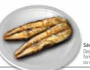
Sável Degustado de três formas: frito, grelhado ou em escabeche