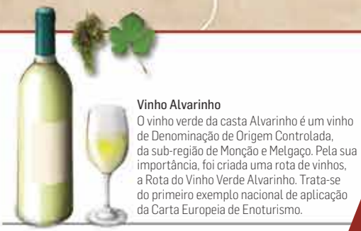
Vinho Alvarinho O vinho verde da casta Alvarinho é um vinho de Denominação de Origem Controlada, da sub-região de Monção e Melgaço. Pela sua importância, foi criada uma rota de vinhos, a Rota do Vinho Verde Alvarinho. Trata-se do primeiro exemplo nacional de aplicação da Carta Europeia de Enoturismo.