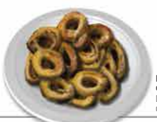
Roscas, Rosquilhos e Papudos Doces tipicamente de romaria