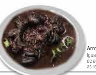
Arroz de Lampreia Iguaria confeccionada de acordo com as receitas tradicionais