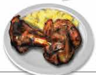
Cordeiro à moda de Monção Consumo no seio familiar

A Gastronomia de Monção apresenta iguarias e sabores singulares. O "Cordeiro à moda de Monção" é sem dúvida o prato mais marcante deste território.