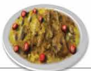
Barrigas de Freira Doce conventual