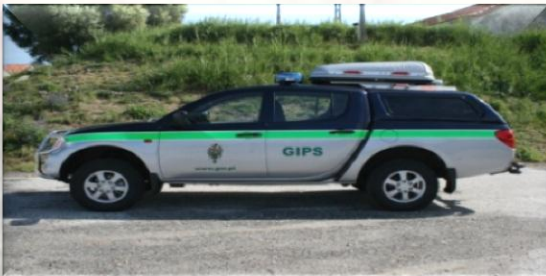
PATRULHAMENTO ARMADO (Apoio / Preventivo / Dissuasor)